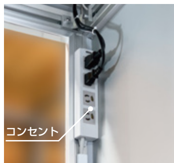
室内にコンセントを用意しました。