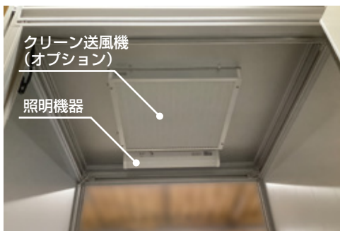
室内側に照明機器が付きます。